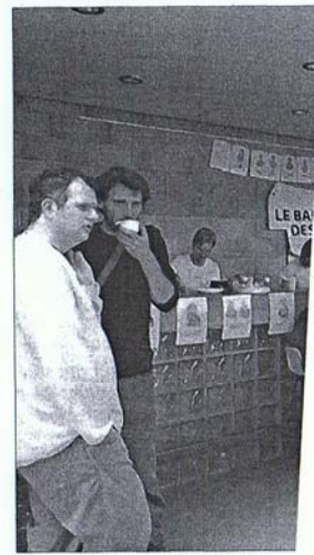
Atelier de maquillage artistique et atmosphère animée du bar sensoriel au centre culturel.