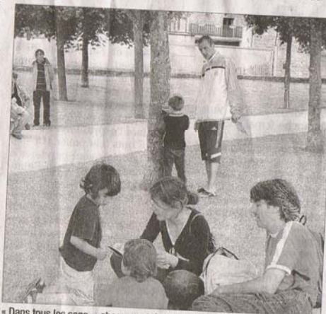
« Dans tous les sens », chasse au trésor sensorielle, ici en 2009, à Chabeuil. □

unique, les yeux bandés (18€ le repas seul ; 5€ le spectacle). Le 9 mai, de 10h30 à 14h, découverte du vol à voile à l'aérodrome de Chabeuil, à partir de 14 ans. Vol de 20 minutes ; 25€; L'après-midi, au centre culturel, s'annonce chargé avec un programme accessible aux enfants. À 14h et 15h « Au bord de l'Os » (danse et marionnettes) par la Compagnie Désuète (5/6€- dès 5 ans). À 14, 15 et 17h, « Bon appétit », découverte du goût en musique, mots et langue des signes » (6/5€ à partir de 3 ans) ; à 16h « Lumen », spectacle poétique et dansé de la Compagnie 158 (6/5€ à partir de 5 ans). Il y aura aussi, à 16h, un atelier en langue des signes française autour du goût, ouvert aux 3-14 ans (3€).