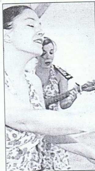
"Bon appétit", spectacle avec une chanteuse entendante et une comédienne sourde. En français oral et langue des signes française.