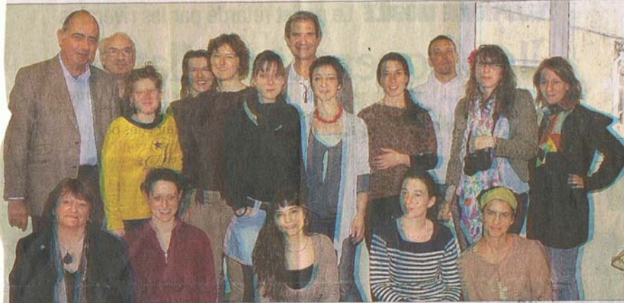
ors de la présentation officielle du Festival Vice et versa.