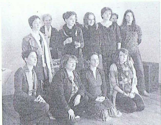
Toute l'équipe de Vice et Versa mobilisée pour une nouvelle saison qui s'annonce riche en rencontres et en rendez-vous.