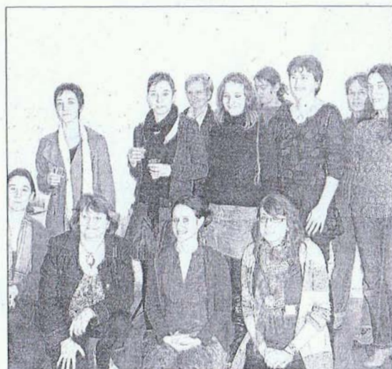
L'équipe de l'association Vice & Versa est prête pour l'Agora.

Pour en savoir plus : Vice & Versa - 11 rue Dupont - 26500 Bourg-lès-Valence - Tel/Fax : 04 75 55 88 85. □