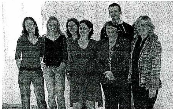
L'équipe de Vice Versa et la compagnie Songes, avec les élus.

La thématique de l'association «Révéler la différence, éveiller les sens» se focalise pour cette première sur l'olfaction. L'Agora se veut ouverte à l'interprétation et à l'échange autour des conférences, ateliers, spectacles, expositions, animations et d'un colloque. Les objectifs étant de rassembler professionnels, handicapés ou non, pour favoriser la mixité, leitmotiv de ces rencontres, mais aussi de catalyser une réflexion, d'éclairer des choix ou encore d'insuffler à une échelle