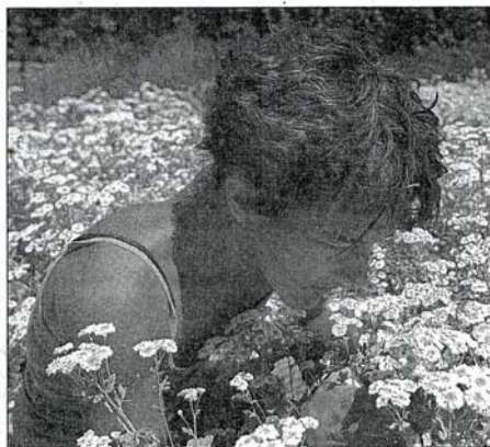
L'association "Vice & Versa" présente sa première Agora.